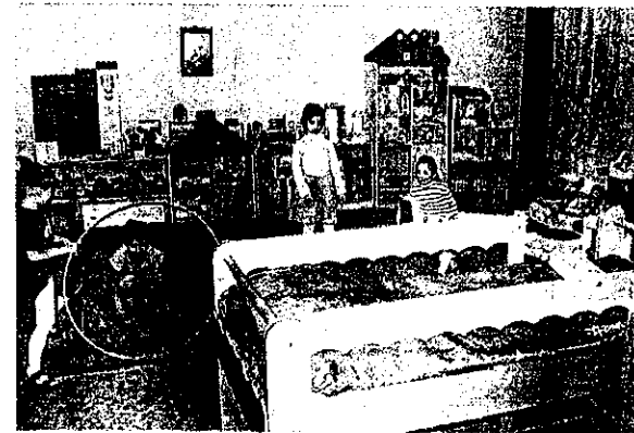
Расширили групповое пространство. Играем в спальне

Четкое выполнение нормативов по расстановке кроватей приводит к тому, что в спальне остаются узкие полосы-проходы, не позволяющие эффективно организовать оздоровительные мероприятия с детьми до и после сна, а также осуществлять воспитательные моменты, связанные с формированием гигиенических навыков дошкольников. Такое обустройство спален не предусматривает выделения полноценного рабочего места для воспитателя, необходимого для подготовки к занятиям и работе с педагогической документацией.