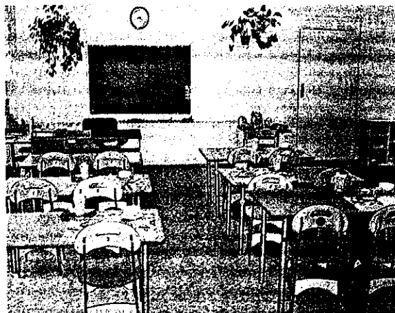
Классно-урочная расстановка мебели в рабочей зоне

Напрашивается вывод: необходимо и возможно расширить границы группового пространства за счет помещений спальни и раздевалки.